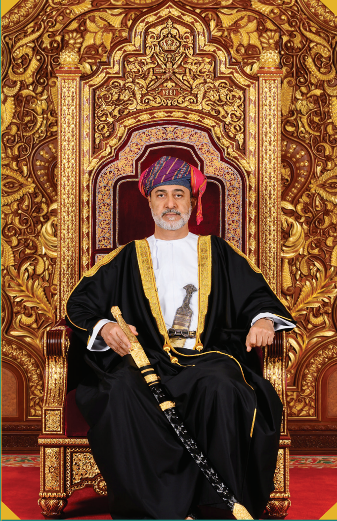
حضرة صاحب الجلالة السلطان هيثم بن طارق المعظم - حفظه الله ورعاه -