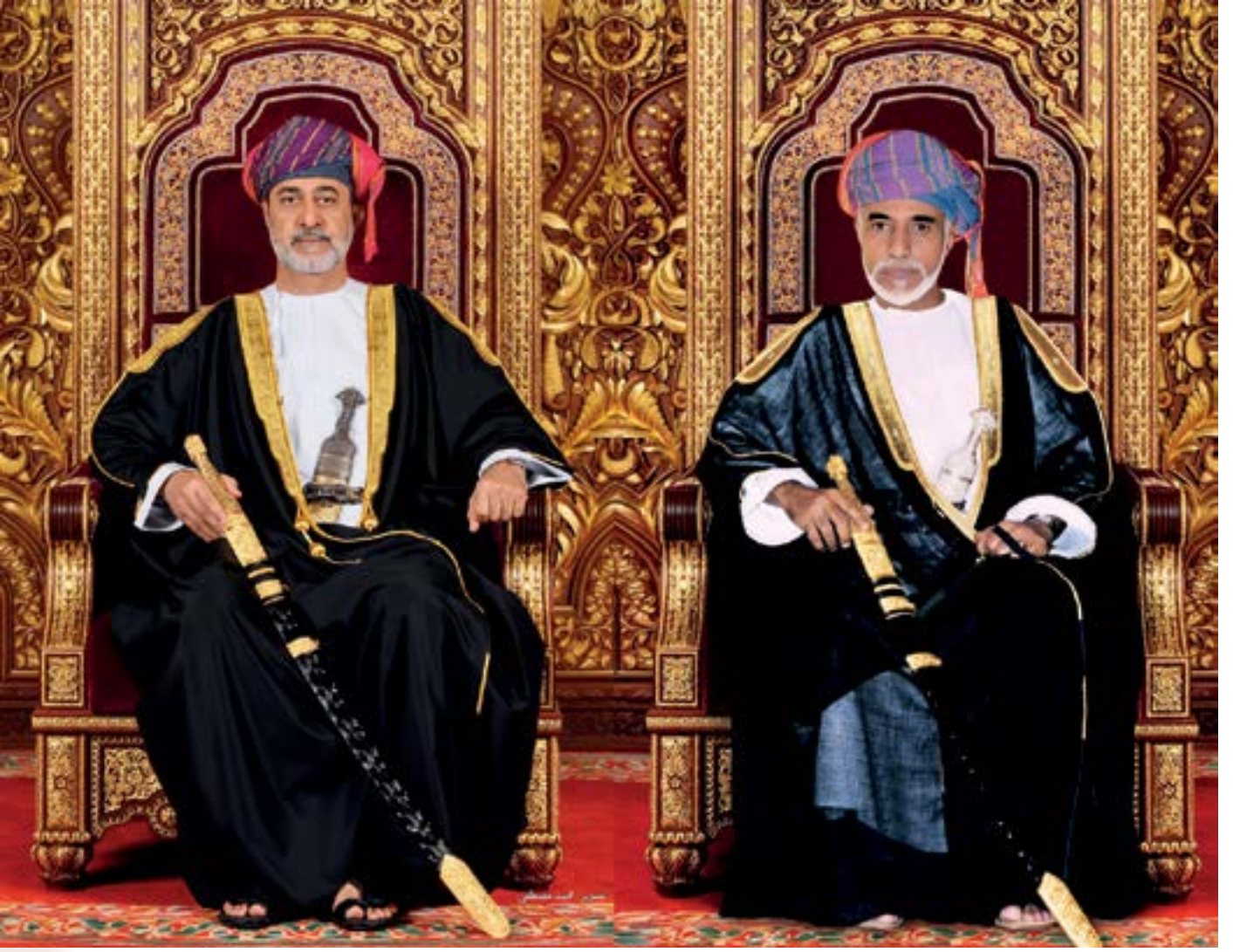
حضرة صاحب الجلالة السلطان هيثم بن طارق المعظم - حفظه الله ورعاه -